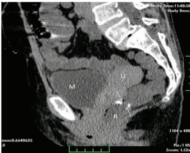
Şekil 3. Rektuma yönelik midsagittal reformasyon BT imajı. Anastomoz düzeyinde, kum saati şeklinde, konsantrik luminal daralma izlenmekte (oklar). R: Rektum; U: Uterus; M: Mesane.